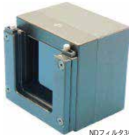
NDフィルタ3枚付属 (ND, ND2, ND3) ND3はカメラに搭載