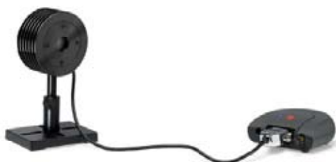
Quasar 単体 (標準ヘッド接続型)