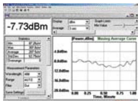
パワー測定画面 (移動平均化グラフ)