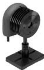
Quasar 搭載型センサヘッド